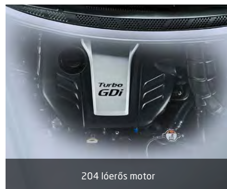
204 lóerős motor