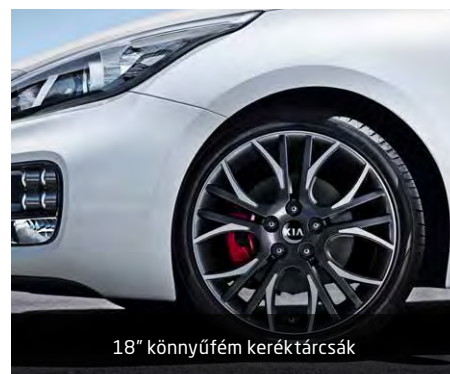
18" könnyűfém keréktárcsák

A fenti adatok tájékoztató jellegűek, a KIA Motors Hungary a mindenkorli változtatás jogát fenntartja. Minden jog fenntartva. © Kia Motors Hungary Kft.