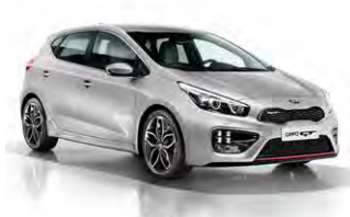
Sparkling Silver (KCS)