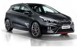
Dark Gun Metal (E5B)