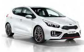
Deluxe White (HW2)