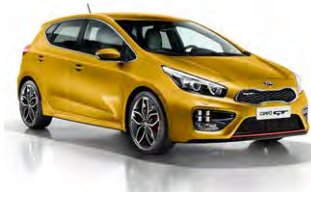
Urban Yellow (AAY)