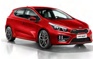
Track Red (FRD)