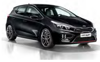
Black Pearl (1K)