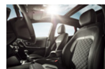
GT Line színvilág