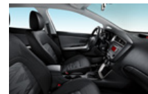
BRONZE és SILVER alapfelszereltség