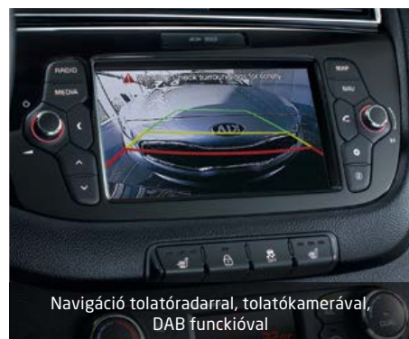
Navigáció tolatóradarral, tolatókamerával, DAB funkcióval