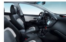
GOLD és PLATINUM alapfelszereltség