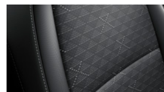
LX fekete szövet