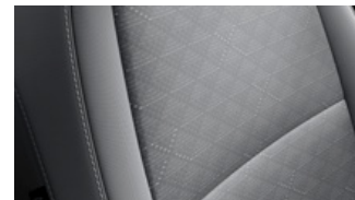
LX szürke szövet