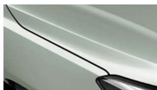
Urban Green (URG)