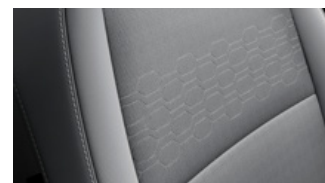
EX szürke szövet