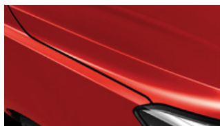
Signal Red (BEG)