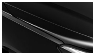
Aurora Black Pearl (ABP)