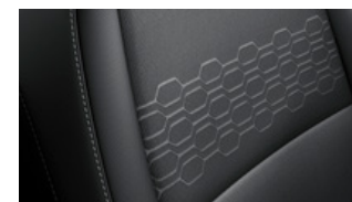
EX fekete szövet