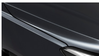
Platinum Graphite (ABT)