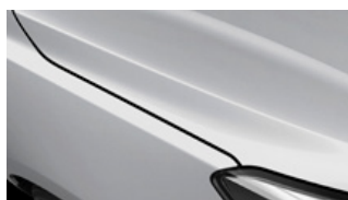
Silky Silver (4SS)