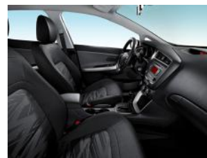
BRONZE és SILVER alapfelszereltség