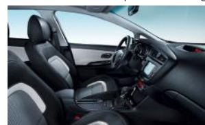
GOLD és PLATINUM alapfelszereltség