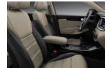
EX opciós kivételű bézs bőrkárpit