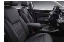
EX alap kivételű selyemfényű fekete szövetskárpit