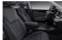
LX alap kivételű selyemfényű fekete szövetskárpit