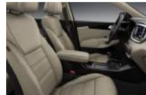
EX alap kivételű bézs szövetskárpit