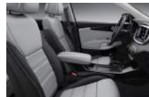
EX opciós kivételű világoszürke bőrkárpit