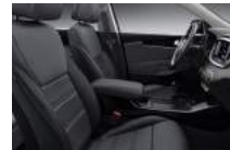
EX opciós kivételű selyemfényű fekete bőrkárpit