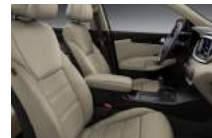
LX alap kivételű bézs szövetskárpit