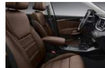
EX opciós kivételű barna bőrkárpit